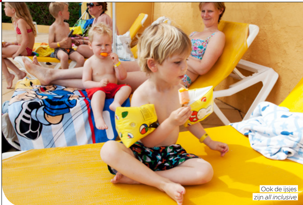
Ook de ijsjes zijn all inclusive